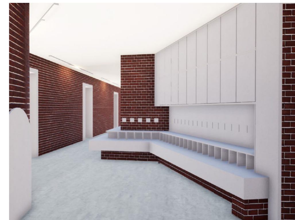
Flur mit Garderobe im Kindergarten