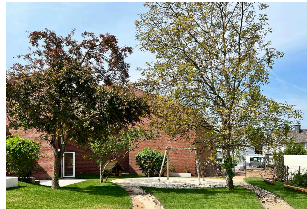
Außengelände des Kindergartens