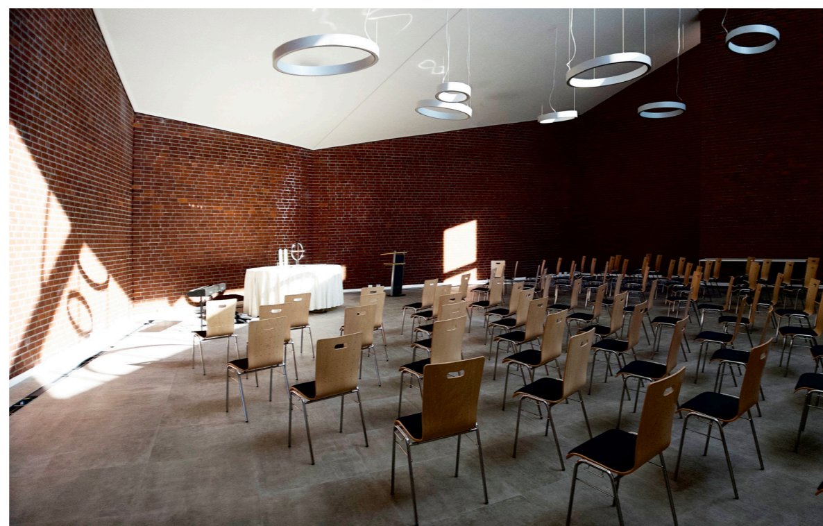
Großer Saal des neuen Gemeindezentrums