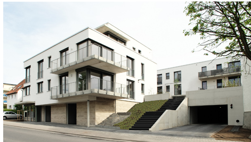
Blick entlang der Ottonenstraße in Richtung Osten