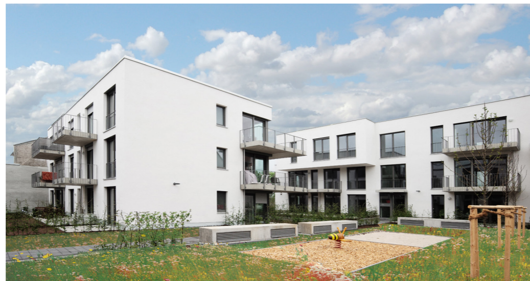
Grüner Innenhof mit Spielfläche für Kinder