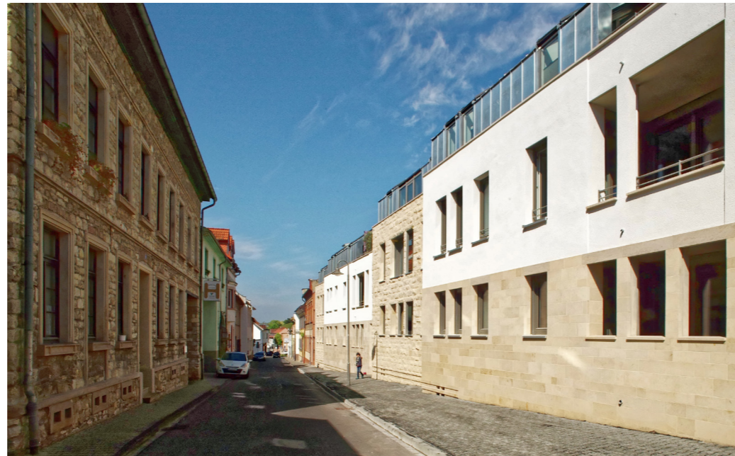
Zeitgemäßer Wohnungsbau auf dem Boden der historischen Siedlung im Vorfeld der historischen Kaiserpfalz.