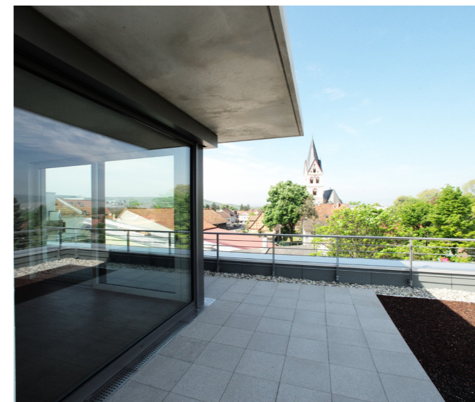
Terrasse im Staffelgeschoss an der Ottonenstraße mit Blick auf den Kirchturm und in das Rheingau